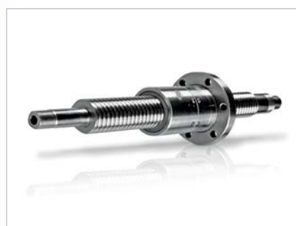
▲ KUGELROLLSPINDELN X, Y, Z