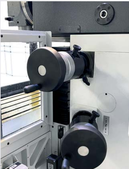
▲ KONVENTIONELLE HANDRÄDER X, Y, Z