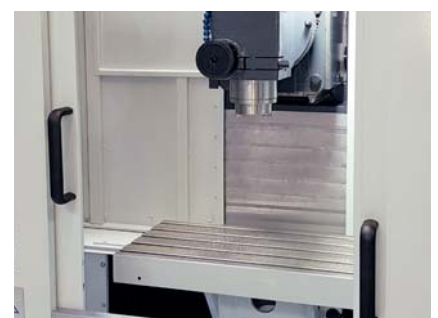
▲ FESTER WINKELTISCH