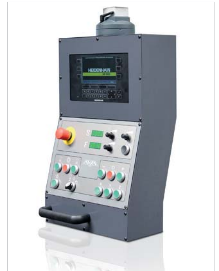
▲ DIGITALANZEIGE 3 AXSEN